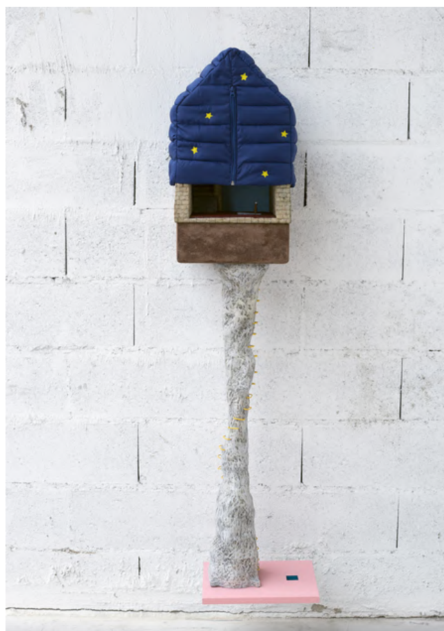
Ci-dessous : La lueur de l'air , 2020, bois, résine acrylique, résine polyuréthane, métal, tissu, LED, peinture acrylique, 146,5 x 40 x 34,5 cm