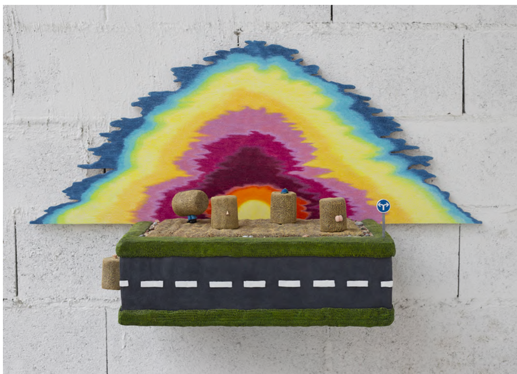
Les Garçons de l'aurore, 2020, Bois, résine polyuréthane, métal, crayons de couleur, peinture acrylique, 55 x 100,2 x 32,5 cm Ci-dessus et ci-dessous