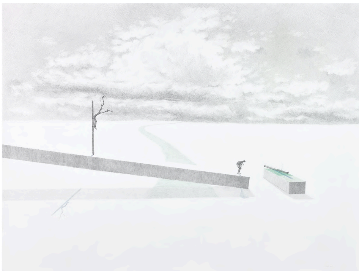
Aube insondable #4 , 2020, Graphite et crayons de couleur sur papier, 75 x 100 cm