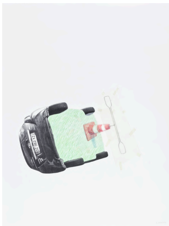
Après l'ordinaire #1 , 2021, Photocopie, graphite et crayons de couleur sur papier et papier calque, adhésif, 50 x 38,5 cm