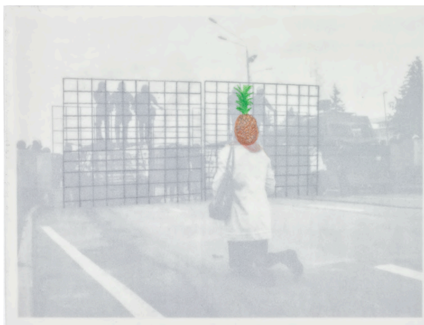
Sans titre #7 , 2021 (série des altérables), Photocopie, graphite et crayons de couleur sur papier calque, 15,5 x 19,8 cm