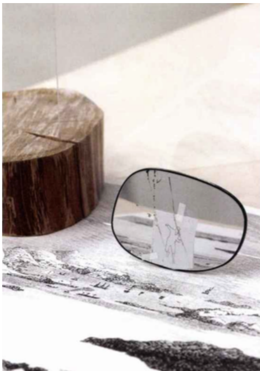
Massinissa Selmani, Dans quel sens traverser les antipodes (détail) 2018, Installation, techniques mixtes, dimensions variables