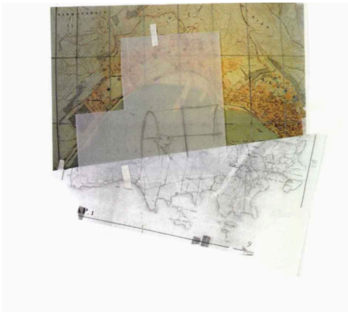
Massinissa Selmani, Dans quel sens traverser les antipodes (détail), 2018, Installation, techniques mixtes, dimensions variables