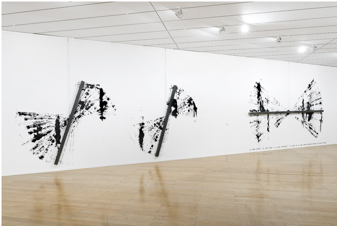
Bernar Venet, La Ligne Droite - La Ligne Objet / La Ligne Instrument / La trace de la Ligne comme mémoire tangible du geste pictural , 2018, métal et acrylique, dimensions variables