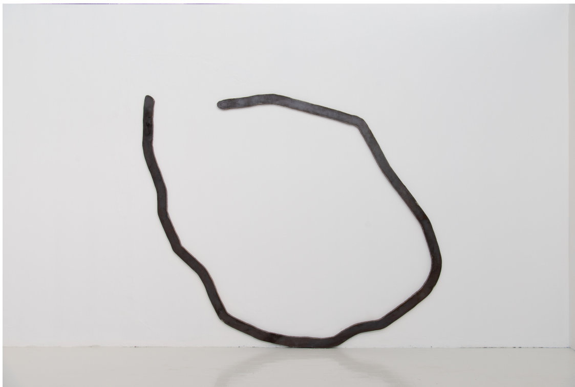
Bernar Venet, Courbe continue , 2018, crédit Jérôme Cavalière, courtesy Archives Bernar Venet et Galerie Anne-Sarah Bénichou

À l'occasion du Paris Gallery Week-end, Anne-Sarah Bénichou invite Bernar Venet pour une exposition autour de la ligne en dialogue avec les artistes de la galerie. Marion Baruch, Julien Discrit, Chourouk Hriech et Valérie Mréjen viendront chacun penser une oeuvre en écho avec la thématique. Dessins muraux, sculptures, oeuvres narratives se confronteront ainsi au travail de Bernar Venet qui présentera, quant à lui, des pièces historiques des années 1960, mais également des réalisations contemporaines ainsi qu'une performance réalisée spécialement pour l'espace.